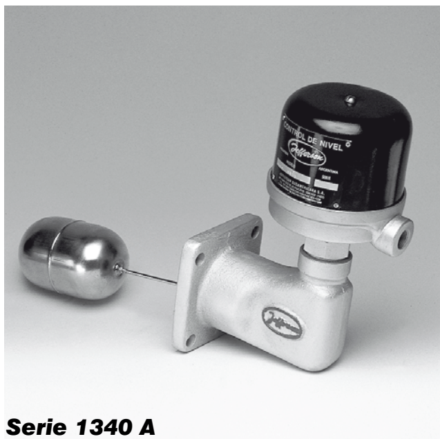
Serie 1340 A