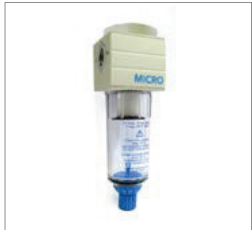
Códigos en Negrita : entrega inmediata, salvo ventas.