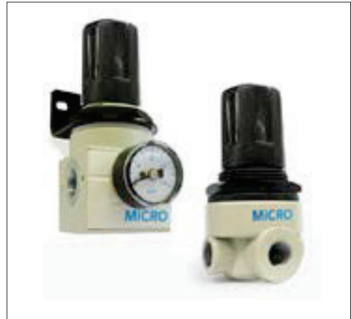
Códigos en Negrita : entrega inmediata, salvo ventas.