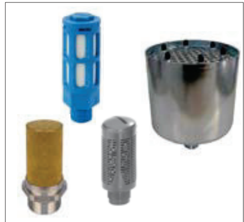
Códigos en Negrita : entrega inmediata, salvo ventas.